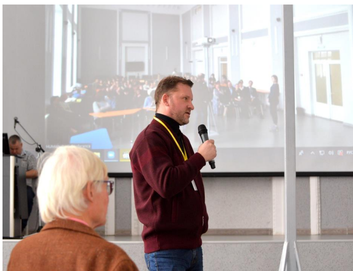
Рисунок 5. Обсуждение фильма «Невозможное» с режиссером Игорем Гончаровым

Третий день в рамках секции «Человек + История» начался с показа художественно-документального фильма «Невозможное» режиссера Игоря Гончарова. Фильм посвящен истории рождения легендарной Магнитки, становлению ее духа, мужества и отваги поколений, ковавших победу в Великой Отечественной войне. На взгляд режиссера фильма, именно в эти годы формировалась духовная матрица города, его ментальное ядро. Фильм снят по проекту с общим названием «Кто мы?», реализующимся с использованием средств гранта Президента Российской Федерации на развитие гражданского общества, предоставленного Фондом президентских грантов в 2020 г.