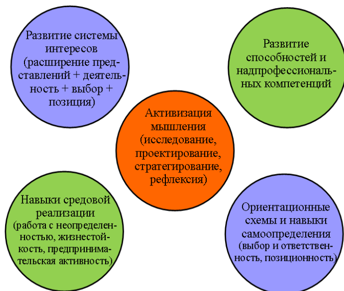
Рис.2. Целевой компонент профориентационной деятельности

венно с профессиональной средой и стимулирует вовлечение их в практическую деятельность, организует помощь в осуществлении выбора направления своей практики и развитие собственной позиции через связывание опыта деятельности с пространством «Я».