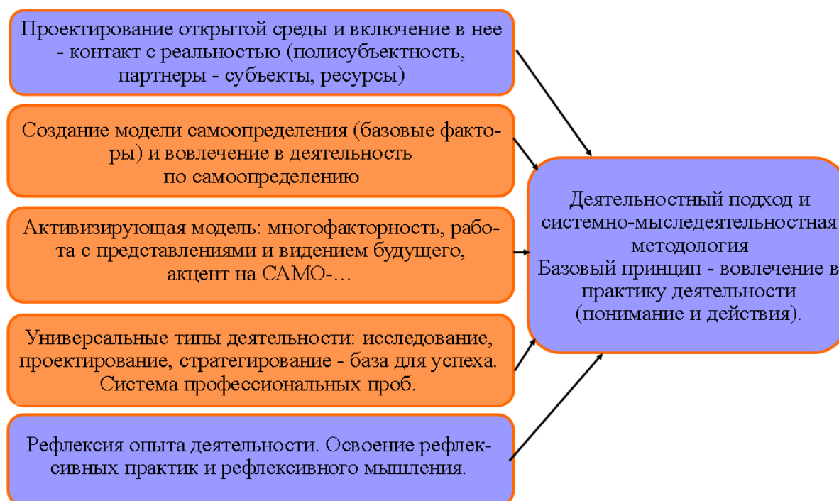
Рис.3. Инструментальный компонент профориентационной деятельности

Инструментальный компонент профориентационной деятельности включает в себя отражение психолого-педагогических средств, которые необходимо использовать для достижения обозначенных выше целевых ориентиров профессионального самоопределения. Понимание нами данного аспекта профориентации отражено на рисунке 3.