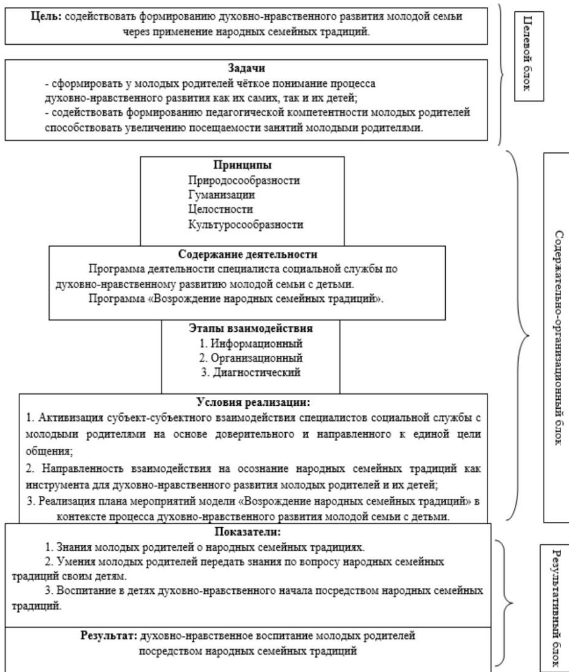
Рисунок 1 – Модель социально-педагогического сопровождения «Возрождение народных семейных традиций»

Базой реализации модели послужило социальное учреждение Челябинской области – МУ